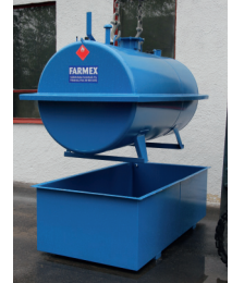
Standardinmukainen säiliö ja valuma-allas