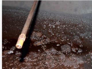
Säiliön pohjalle kertynyttä moskaa