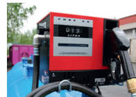
Mittari ja automaattipistooli