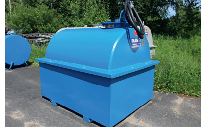
FARMEX valuma-allas pulttikiinnityksellä