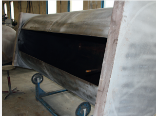
Pohja leikataan pois koko säiliön pituudelta.