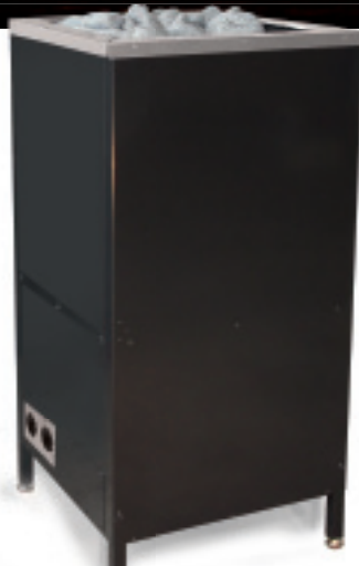
Aino Savu – musta