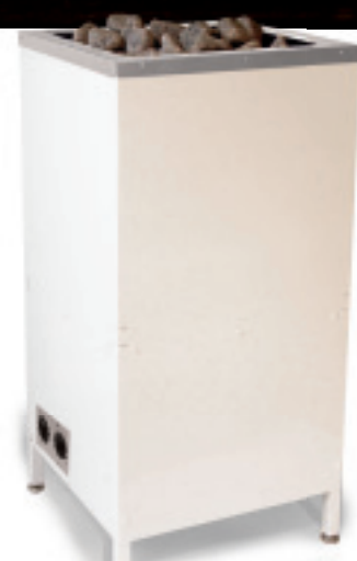
Aino Vaalea – valkoinen